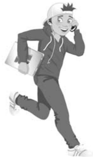
Jeannot Techno Le détective

Départ : le zodiac Maison : le poste d'observation en F